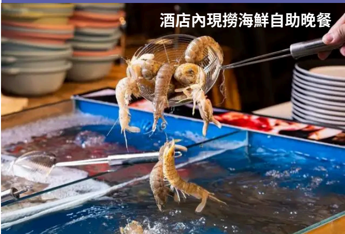
酒店內現撈海鮮自助晚餐

早餐： ~ 午餐： 私廚殿堂·琵琶鴨宴 晚餐： 酒店內52樓高空享用“現撈海鮮自助晚餐” 住宿： 5星標準南海希爾頓和華酒店或同級