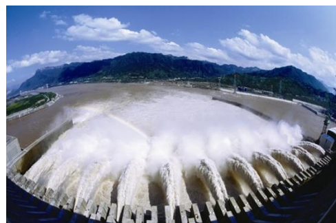
長江三峽大壩工程